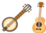
des instruments à corde